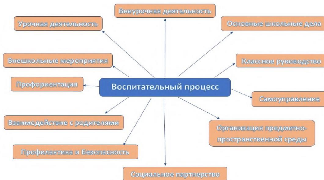
Схема построения воспитательного процесса

В соответствии с указами Президента Российской Федерации от 7 мая 2018 г. N 204 "О национальных целях и стратегических задачах развития Российской Федерации на период до 2024 года" в МБОУ «СШ № 65» была введена должность советника директора по воспитанию и взаимодействию с детскими общественными объединениями.